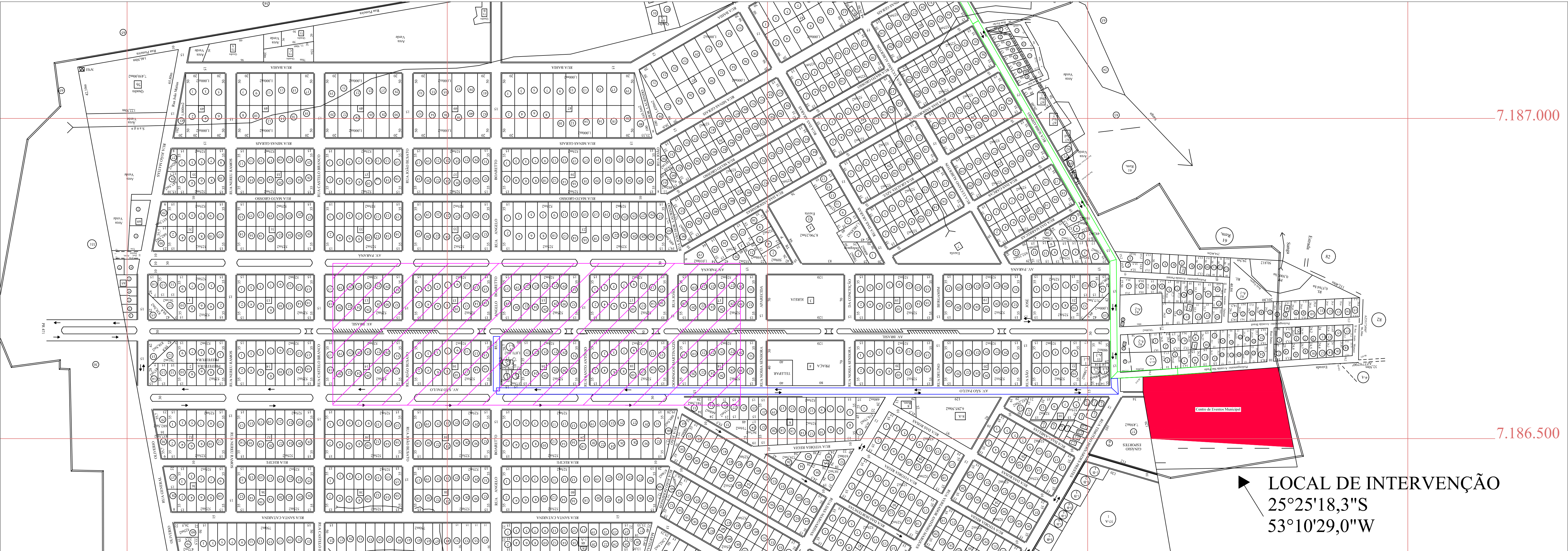
Planta de Localização Sem Escala